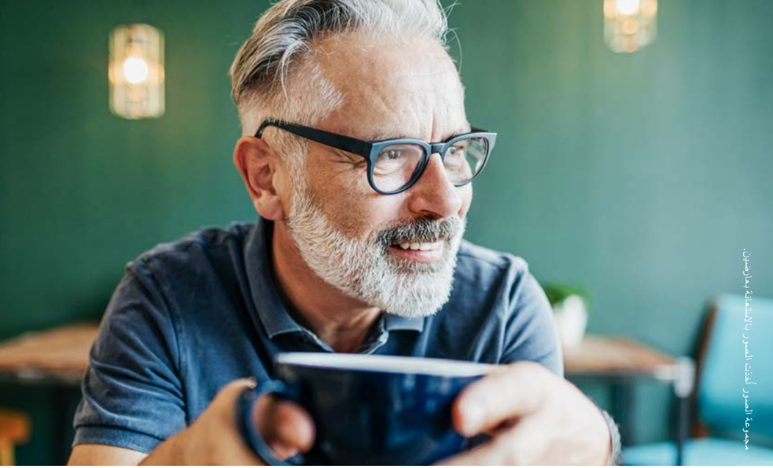
مجموعة الصور أبحاث الصور للأشعة بعراضين.

ملحوظة: طبيبك المعالج هو الذي يقرر نوع العلاج. فهو على دراية بك وبمسار مرضك ويمكنه اختيار العلاج الأكثر فعالية بالنسبة لك. لكن من المهم أن تشارك رغباتك ومخاوفك وهمومك مع طبيبك دائمًا في موعد الزيارة.